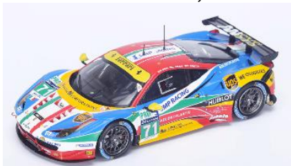
LSLM025 Ferrari 458 Italia # 71 24h Le Mans 2015 LM GTE Pro Rigon / Calado / Beretta € 99,95