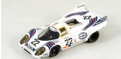
43LM71 Porsche 917 K # 22 Sieger 24h Le Mans 1971