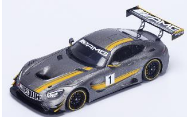
431084 Mercedes-Benz GT GT3 2015 Präsentation