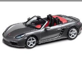
Porsche 911 (991/II) Carrera S orange Tennis Grand Prix 2016 Porsche 718 Boxster S achatgrau metallic Porsche 919 Hybrid Präsentation 2016 Porsche Mission E, weiß