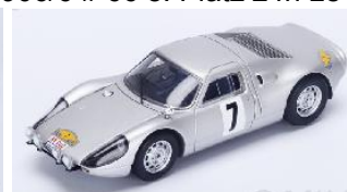
SF0093 Porsche 904 GTS # 7 Sieger Rallye des Routes du Nord 1967 Gaban / Pedro