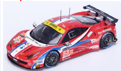
LSLM031 Ferrari 458 Italia # 83 24h Le Mans 2015 LM GTE Am Perrodo / Collard / Aguas € 99,95

Alle Angaben zu Preisen, Farben, Ausführungen und Liefertermin erfolgen OHNE GEWÄHR, Änderungen in Form, Farbe und Preis vorbehalten