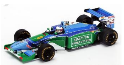
434481 Benetton B194 # 5 Sieger F1 GP Monaco 1994 Michael Schumacher