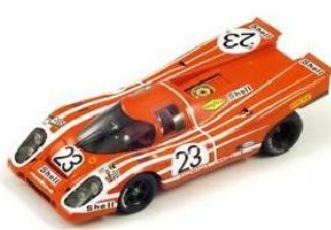
43LM70 Porsche 917 L # 23 Sieger 24h Le Mans 1970