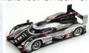
43LM11 Audi R18 TDI # 2 Sieger 24h Le Mans 2011 Fässler / Lotterer / Treluyer