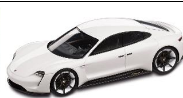
€ 59,95 € 55,95 € ? ca. € 74,50