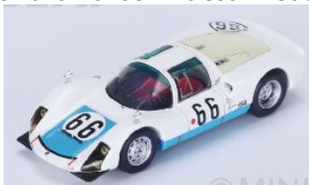
434744 Porsche 906/6 # 66 8. Platz 24h Le Mans 1967 G. Koch / C. Poiret