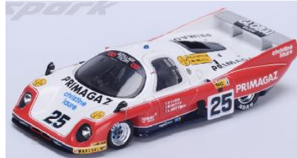
432272 Rondeau M 379 C # 25 24h Le Mans 1982 P. Yver / B. Sotty / L. Guittény