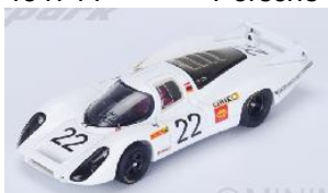
434747 Porsche 908L # 22 24h Le Mans 1969 R. Lins / W. Kauhsen